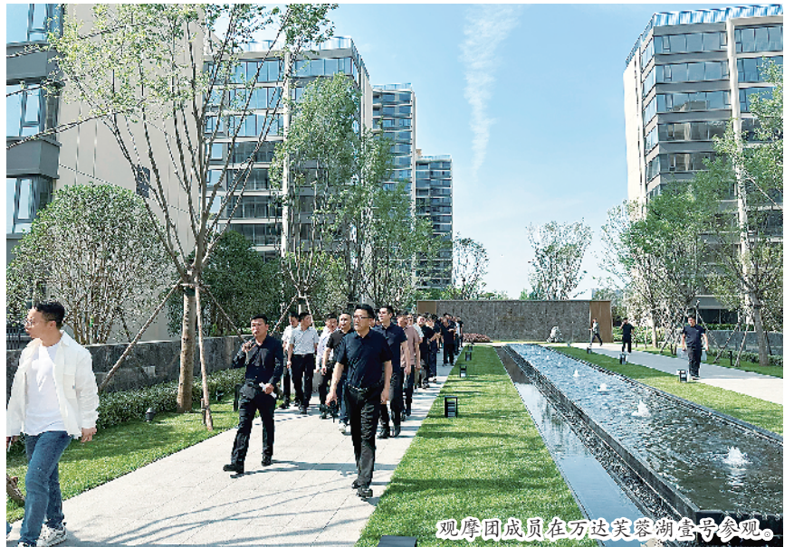
观摩团成员在万达芙蓉湖壹号参观。